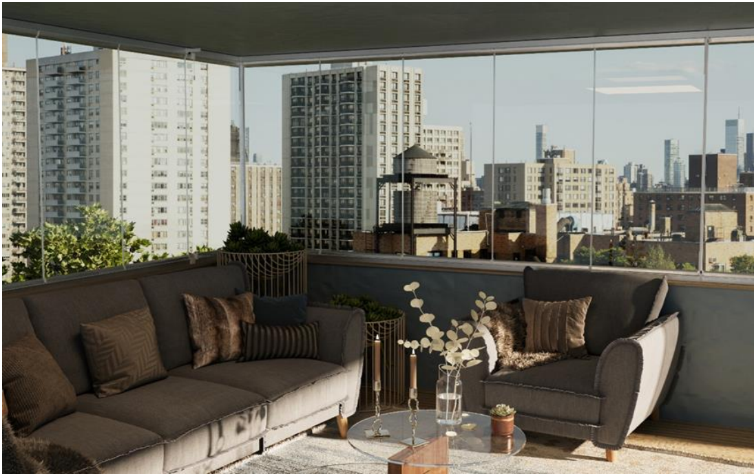
Un balcone protetto da vepa

Immaginiamo di poter sfruttare i milioni di balconi, loggiati e spazi esterni inutilizzati, esistenti in Italia, come piccole centrali termiche: è indubbio che sarebbe di un certo aiuto nell’immane lotta ai cambiamenti climatici.