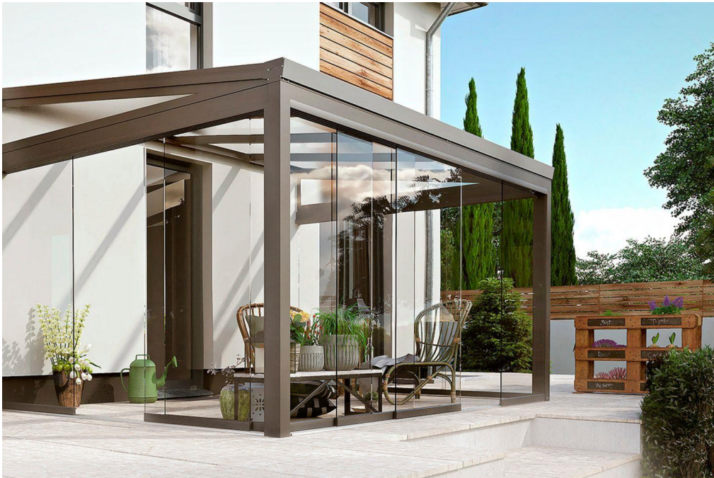
Una serra solare climatica o “giardino d'inverno”

Molto anni fa i Paesi del nord Europa hanno dimostrato che permettere la fruizione di spazi esterni domestici altrimenti inutilizzati e sprecati, grazie all'utilizzo delle serre climatiche (i famosi “ wintergarden ” o giardini d'inverno), ha ridotto sensibilmente la domanda di nuova cementificazione, consumo di territorio, occupazione di terreno e impermeabilizzazione del suolo (e conseguenti criticità idrogeologiche). Non solo. Queste serre solari, “captanti” e “tamponate”, di giorno distribuiscono per entropia il calore del sole agli ambienti interni; mentre di notte riducono le dispersioni termiche dei muri e degli infissi. Determinando, tra l'altro, risparmio energetico ed economico e minori immissioni di CO 2 nell'atmosfera.