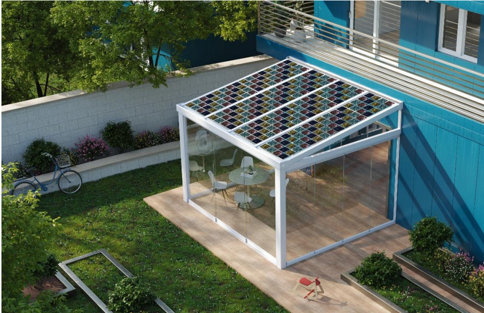
Una piccola serra solare domestica ed energetica

Non sarebbe tutto ciò nell'interesse della nazione, della collettività, dei parametri richiesti dalla UE, e della nostra stessa sopravvivenza?