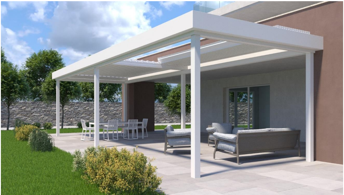
Una pergola frangisole a lamelle orientabili e/o retraibili

Che poi la parte superiore o copertura possa essere orientabile e/o retrattile, non cambia nulla. Rimangono comunque delle strutture precarie. E qual è lo scopo, l’utilizzo, la finalità di queste strutture? Poter utilizzare e fruire meglio gli spazi esterni alla casa, rendendoli più confortevoli e protetti dagli agenti climatici. Tutto qui.