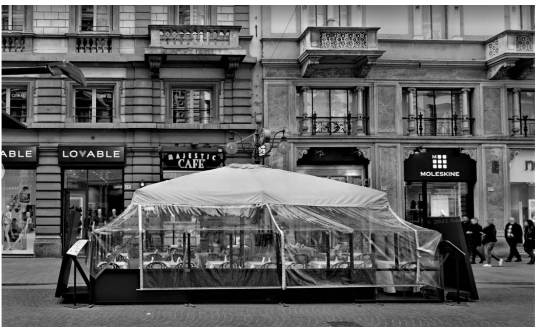
Un dehor “plastificato” sull'elegante via Dante a Milano

Come abbiamo inoltre puntualmente documentato e dimostrato nella seconda parte del libro sopra citato, la situazione dell'OSP (occupazione suolo pubblico) in Italia è davvero imbarazzante. Le nostre città d'arte sono diventate degli accampamenti nomadi. Sul versante autorizzazioni è ancora peggio: abbiamo 7.900 Comuni con autonomia decisionale sul proprio territorio per cui, a pochi chilometri di distanza, cambiano i regolamenti e vigono ovunque confusione normativa, difformità urbanistica, assenza di decoro architettonico ed estetico. A discapito della nostra immagine e del nostro appeal turistico nel mondo.